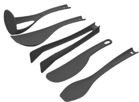
SET DE UTENSILIOS DE USO GENERAL