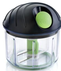
MULTIPROCESADOR DE VEGETALES