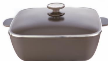
CACEROLA CUADRADA 29CM