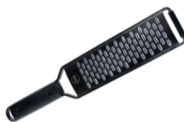
RALLADOR DE MANO CINTA