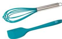
ESPÁTULA Y BATIDOR DE SILICONA