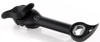
ABRELATAS 5 EN 1