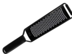
RALLADOR DE MANO GRANO MEDIO