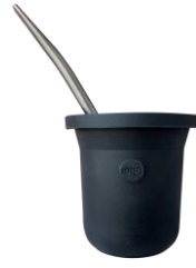
SET DE MATE NUIT