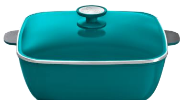
CACEROLA CUADRADA 29CM