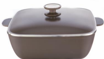
CACEROLA CUADRADA 29CM