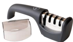
AFILADOR DE CUCHILLOS 4 PASOS