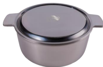
CACEROLA 24CM INOX