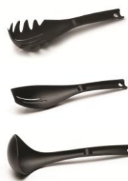
SET DE UTENSILIOS PARA PASTAS