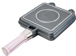
FLIP 2.2 22x22CM