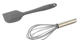
ESPÁTULA Y BATIDOR DE SILICONA