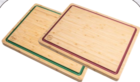
TABLA DE BAMBÚ 30X40CM