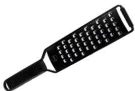
RALLADOR DE MANO GRANO GRUESO