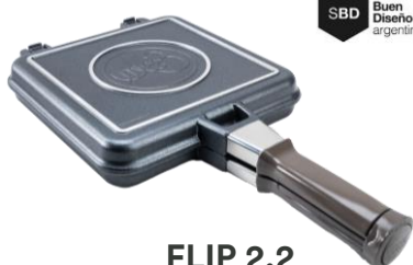
FLIP 2.2 22x22CM