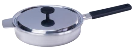
SARTÉN 24CM INOX