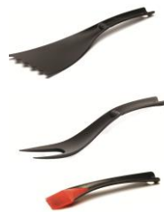
SET DE UTENSILIOS PARA CARNES