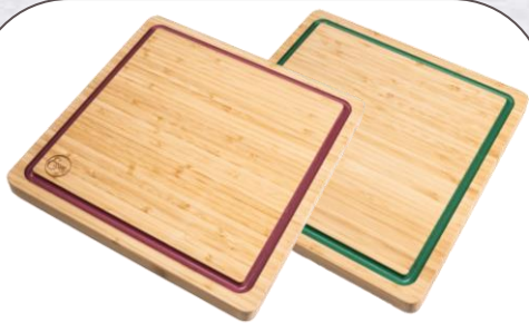
TABLA DE BAMBÚ 30X30CM