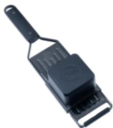
MANDOLINA DE MANO