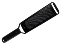
RALLADOR DE MANO GRANO FINO