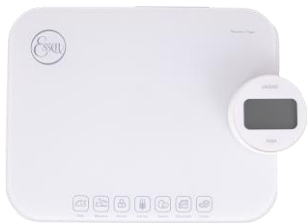
BALANZA ECO 2 EN 1