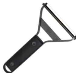
REBANADOR DE QUESO