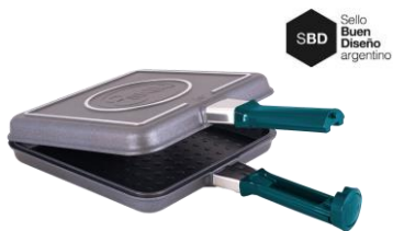
FLIP 2.2 22x22CM Capacidad 2 L | Comensales: 2