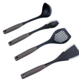
SET DE UTENSILIOS